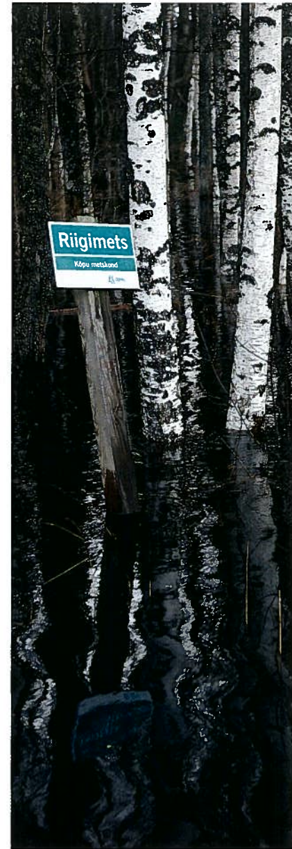
VESI OHUSTAB: Eesti ja Soome kuuluvad Euroopas riikide hulka, kus on suur üleujutuste oht. Soojenev kliima muudab vesised metsaalused aina tavalisemaks.

«Võib püüda kasvatada nii, et taimel oleks kõike piisavalt – vett ja toitaineid, aga see on kallis ja pole seetõttu jätku-