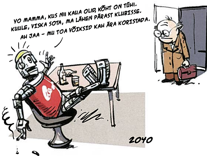
JOONISTANUD TOOMAS PÄASUKE

Veelgi enam, kui üritaksin täna öelda kellelegi, et sa pole inimene, kuna sinu välimus mulle ei meeldi, ootaks mind ilmselt kohtutee.