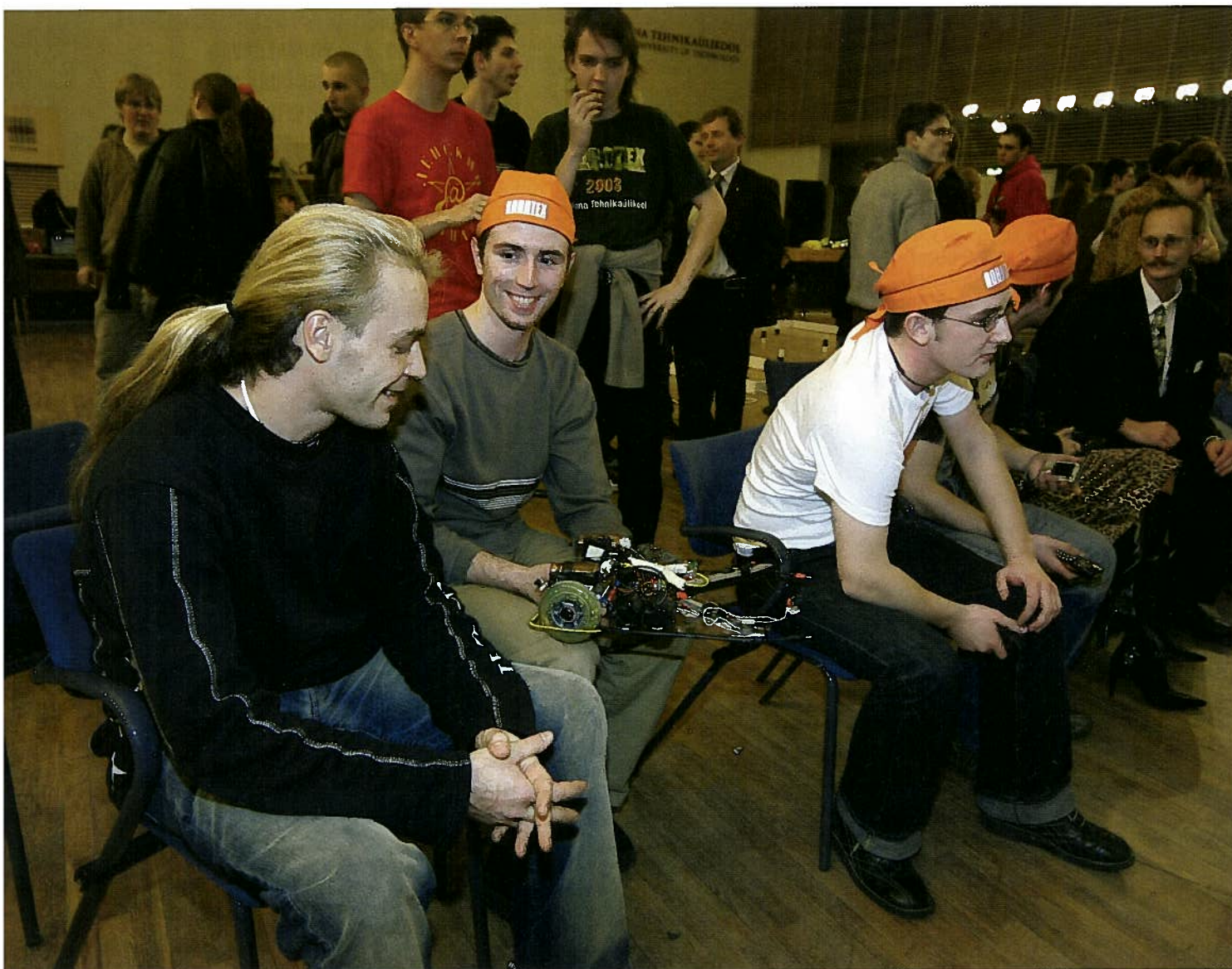
Hetk robotivõistlusest ROBOTEX 2004. ROBOTEX on Tallinna Tehnikaülikooli, Tartu Ülikooli ja IT Kolledži korraldatud robotivõistlus.

täis, ja insener ei suuda kuidagi kõiki ohuolukordasid ette näha.