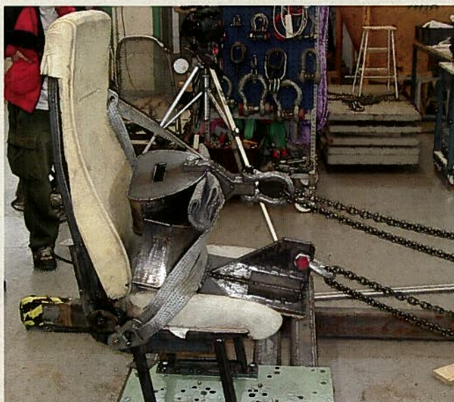
Istme katsetamine Tampere VTT laboris.