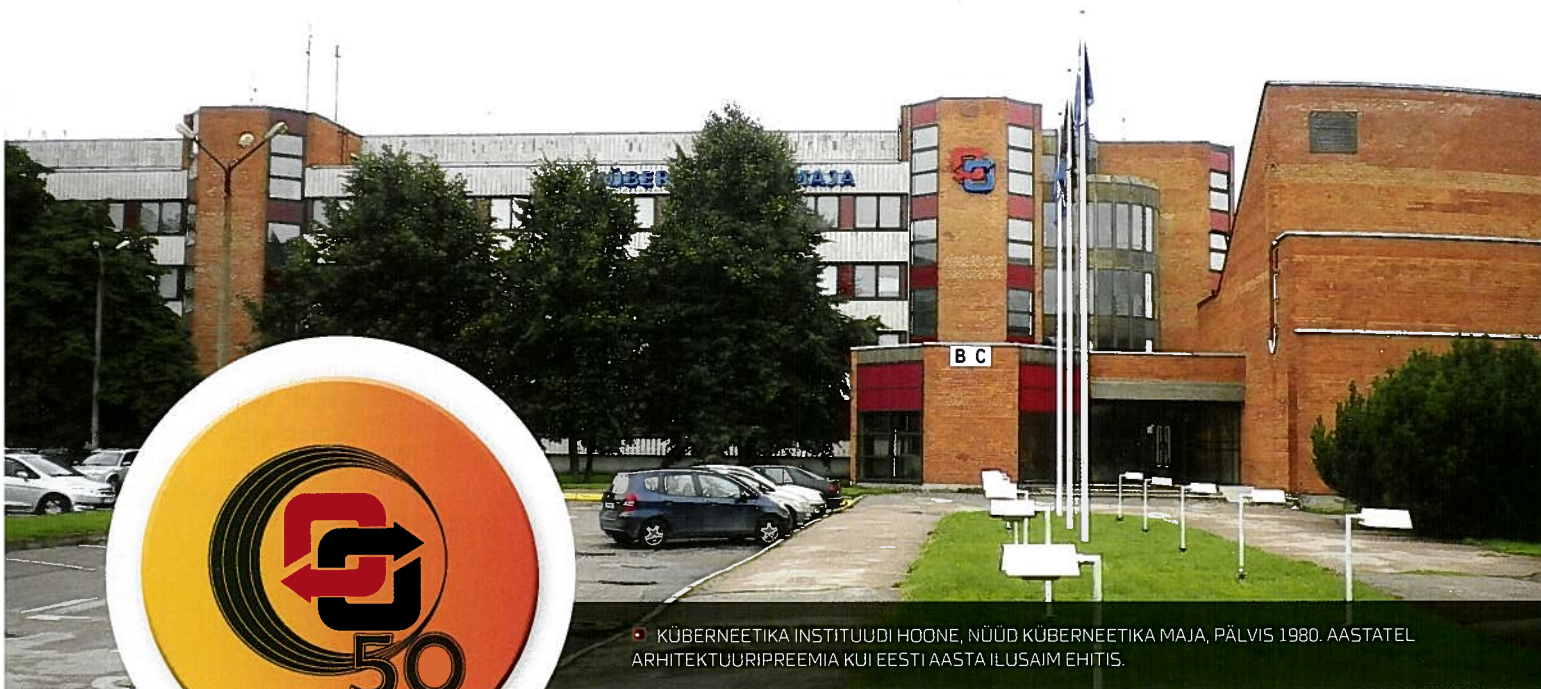
• KÜBERNEETIKA INSTITUUDI HOONE, NÜÜD KÜBERNEETIKA MAJA, PÄLVIS 1980. AASTATEL ARHITEKTUURIPREEMIA KUI EESTI AASTA ILUSAIM EHITIS.